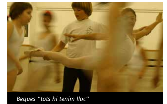
Beques "tots hi tenim lloc"

La FAC ha destinat 1.450€ al 2n trimestre del programa social "Tots hi tenim lloc". Així, 7 entitats federades s'han beneficiat d'aquest ajut que permet becar places a activitats que es realitzen als ateneus per combatre el risc d'exclusió social. En total, d'abril a juny, 27 persones (14 dones i 13 homes) d'entre 6 i 57 anys han estat becades. A més, enguany la FAC ha invertit 1.000€ en beques de casals d'estiu de les que han gaudit 4 entitats. En total, 10 infants d'entre 5 i 15 anys s'han beneficiat de les beques. La beca permetia pagar els primers 30€ de cada setmana de casal. Aquest avantatge ha suposat un estalvi d'entre el 50 i el 60% de despesa a les famílies que s'hi han acollit. Fins l'11 de desembre es poden enviar places becades pel 3r trimestre (setembre-desembre).