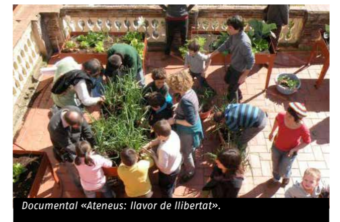
Documental «Ateneus: llavor de llibertat».

El proper número de la revista "Ateneus", editada per la FAC, versarà al voltant de les entitats i la sostenibilitat del medi ambient. La publicació semestral se centrarà en els projectes i/o activitats que els ateneus i casals del país duen a terme per a la dignificació i preservació de l'entorn: campanyes verdes i/o de reciclatge de residus, cicles de cinema temàtics, excursionisme o altres activitats de foment del coneixement de la natura i el territori, etc. Pel que demanem a les entitats adherides interessades a aparèixer a la publicació del mes de desembre a fer-nos arribar les seves propostes al correu comunicacio@ateneus.cat .