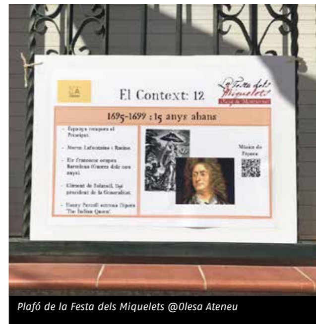
Plafó de la Festa dels Miquelets @Olesa Ateneu

La Festa dels Miquelets escenifica anualment els fets ocorreguts a la vila d'Olesa de Montserrat durant la Guerra de Successió (1705-1714), en la que aquestes unitats d'èlit van lluitar defensant la causa austriacista de Carles III. En l'edició celebrada el primer cap de setmana de setembre, OlesaAteneu ha creat uns plafons que recreen aquesta part de la història i que els visitants s'han trobat a diversos carrers de la localitat.