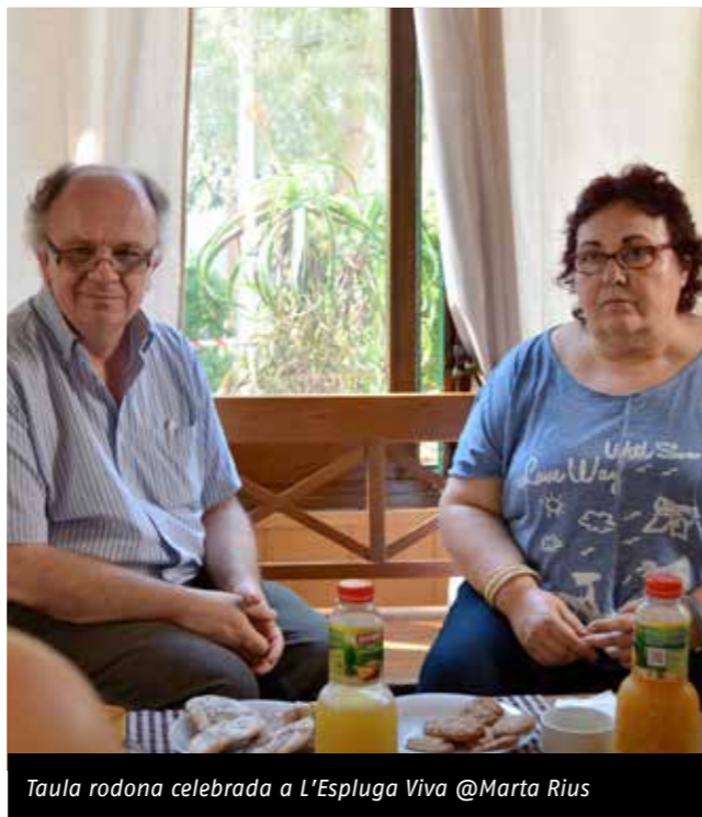
Taula rodona celebrada a L'Espluga Viva

L'Espluga Viva (Esplugues de Llobregat) va acollir, el 10 de juny, una taula rodona entre membres d'ateneus federats al voltant de les aportacions que aquestes entitats han propiciat en el terreny literari català: biblioteques, presentacions de llibres, tallers i concursos d'escriptura, grups de lectura, lectures dramatitzades, etc. El denominador comú va ser la voluntat de generar debat i alimentar una societat crítica per a la transformació del seu entorn. Els continguts de la taula es van publicar a l'apartat Interessos Comuns de la revista "Ateneus 17", que es pot consultar al web www.ateneus.cat .