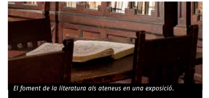
El foment de la literatura als ateneus en una exposició.