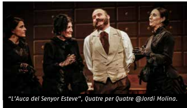
"L'Auca del Senyor Esteve", Quatre per Quatre @Jordi Molina.

Aquest 2017, la Xarxa de Teatres d'Ateneus de Catalunya ha teixit aliances amb la Fira Mediterrània que celebrarà la seva 20ena edició del 5 al 8 d'octubre a Manresa. Fruit de la bona entesa, es traduirà en la presència de la XTAC en un estand de la Llotja de professionals i permetrà als programadors de la xarxa inscriure's gratuïtament per poder assistir-hi. A més, la Fira cedirà un espai a la XTAC per a que celebri el V Consell de Programadors. D'altra banda, el 8 d'octubre a les set de la tarda, s'hi podrà veure "L'Auca del Senyor Esteve", la primera producció teatral de la Federació d'Ateneus de Catalunya i la companyia Quatre per Quatre.