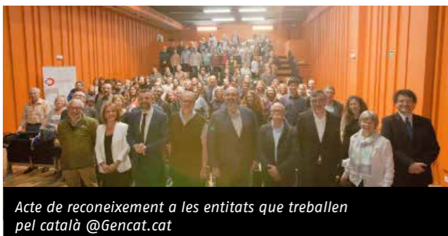
Acte de reconeixement a les entitats que treballen pel català @Gencat.cat

Aquest 2017 sumem 24 ateneus membres de la FAC al Cens d'entitats de foment de la llengua catalana. La Federació d'Ateneus també n'és membre. Formen part d'aquest Cens les entitats que ho hagin demanat i que en els seus estatuts especifiquin que realitzen activitats de promoció de la llengua catalana. Pel fet de formar part del Cens els socis i les persones que realitzin alguna donació a les entitats adherides poden beneficiar-se de desgravacions fiscals. Les entitats que en formen part cada any han de renovar l'adhesió mitjançant una memòria on es justifiquen les activitats de promoció de la llengua dutes a terme.