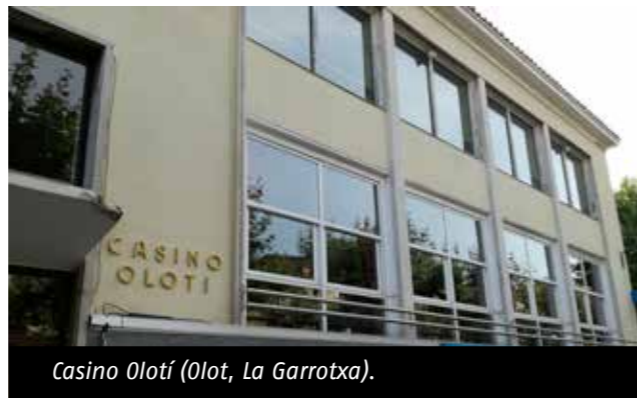
Casino Olotí (Olot, La Garrotxa).