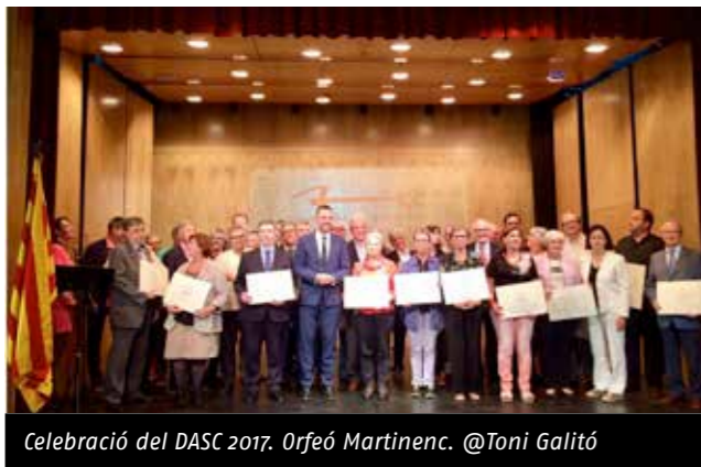
Celebració del DASC 2017. Orfeó Martinenc.

L'Orfeó Martinenc (Barcelona) va acollir, l'1 de juny, l'acte oficial del Dia de l'Associacionisme Cultural Català (DASC). Xavier Filella, expresident del Centre de Lectura de Reus, va impartir la conferència "La cultura que ha generat el Centre de Lectura de Reus". Un total de 92 equipaments i/o entitats –entre elles ateneus federats– van programar 109 activitats programades en 53 municipis catalans amb la voluntat de mostrar a la ciutadania la tasca diària, les instal·lacions i l'oferta associativa del país.