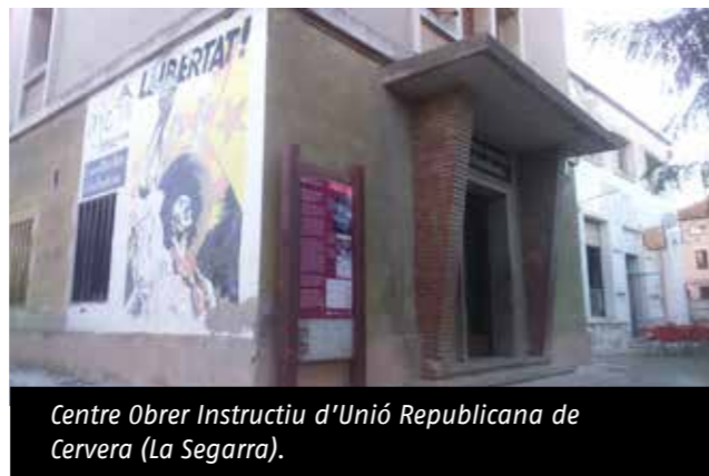
Centre Obrer Instructiu d'Unió Republicana de Cervera (La Segarra).