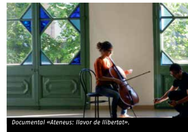
Documental «Ateneus: llavor de llibertat».

La Federació d'Ateneus de Catalunya ha recollit 3.000 euros per produir el documental «Ateneus: llavor de llibertat» gràcies a les aportacions efectuades per entitats i particulars a la plataforma de mecenatge habilitada per fer realitat la iniciativa. Encarregat a la productora audiovisual catalana Nosotros, el llargmetratge narrarà en una hora l'aportació dels ateneus, casals i casinos com a l'associacionisme cultural propi de Catalunya. Un llegat identitari que ha contribuït a la socialització i culturització de diversitat de generacions i estrats socials del país durant dos segles. També posarà de relleu la vigència i efervescència de l'ateneisme en ple segle XXI. La campanya de mecenatge estarà activa fins a final d'any al portal www.ateneus.cat/documental/ . Està oberta a tota la ciutadania que vulgui col·laborar econòmicament amb aportacions que seran gratificades amb recompenses com aparèixer als títols de crèdit o entrades per assistir a l'estrena.