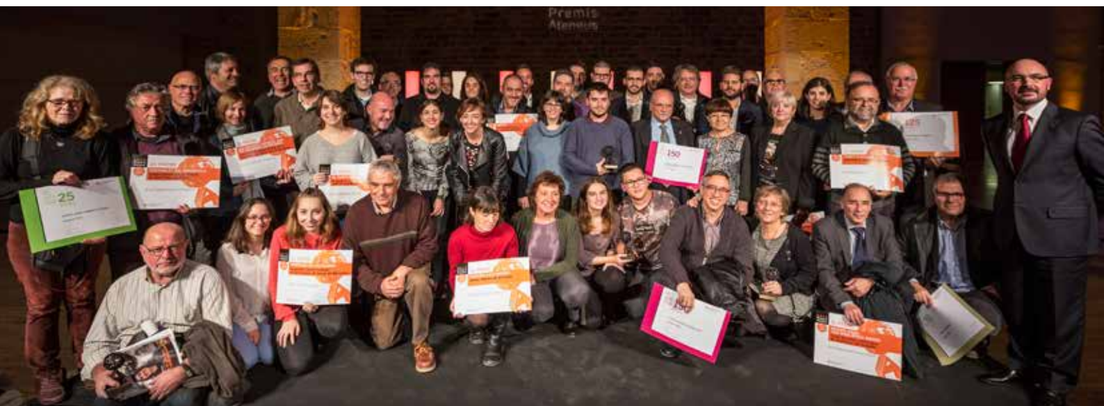
Foto de família de les entitats reconegudes als PremisAteneus 2016. Drassanes Reials de Barcelona.

Enguany, la FAC ha modificat la nomenclatura d'algunes categories. El Premi als Mitjans de Comunicació passa a denominar-se "Premi a la Comunicació Associativa" i el Premi a la Integració Social es converteix en el "Premi al Treball en Xarxa". A més, en aquesta edició, el tercer premi de cada categoria atorgarà una dotació econòmica de 300€ a les candidatures guanyadores.