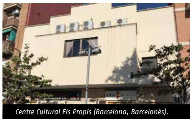
Centre Cultural Els Propis (Barcelona, Barcelonès).