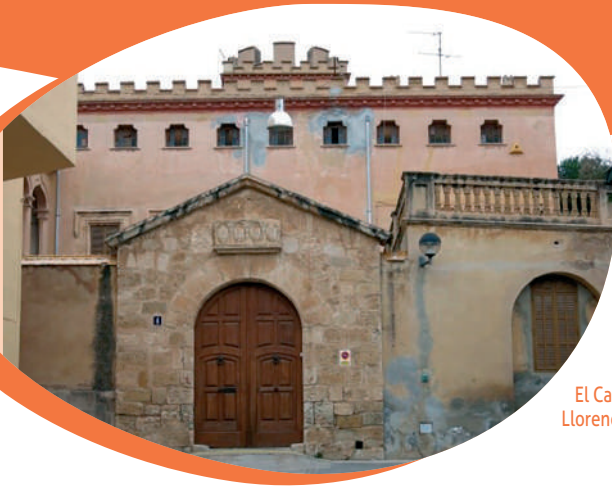
El Castell de Llorenç del Penedès