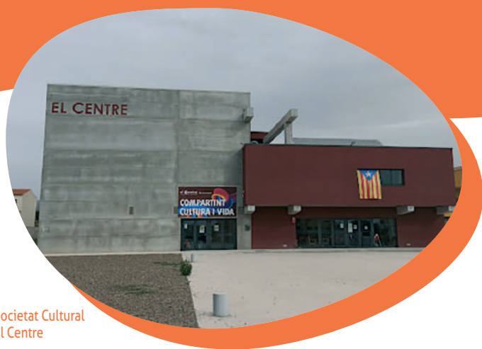
Societat Cultural El Centre

cooperatiu és fruit de la unió dels pagesos de les dues entitats culturals del poble per millorar les condicions de la pagesia.