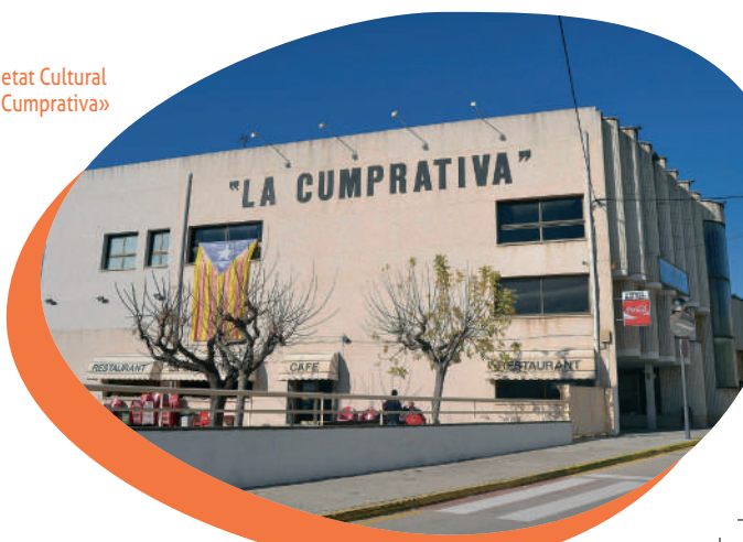
Societat Cultural «La Cumprativa»

Finalment, tornarem pel mateix Carrer de l'Abat Escarré per tornar a l'inici de la Rambla de la Marinada. A l'inici d'aquesta es troba situat l'últim punt de la ruta, la Societat Cultural «La Cumprativa» , ateneu que també visitarem.