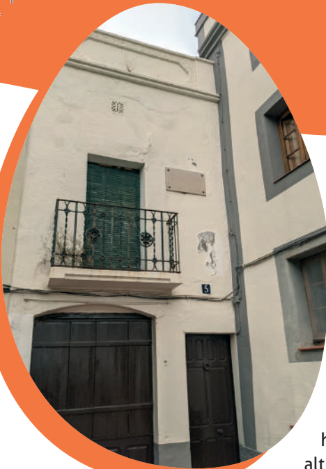
Casa Nadiua dels Romagosa

L'edifici actual fou construït sobre l'antic ajuntament, ubicat en aquest lloc des de 1919.