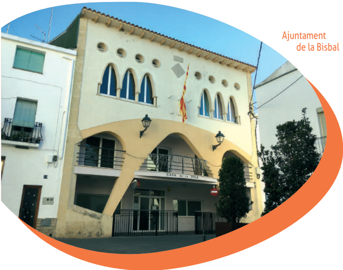
Ajuntament de la Bisbal

Anteriorment havia ocupat un altre ubicació del carrer major, fins que l'estat ruïnós de l'edifici que des de temps immemorial feia de casa del comú obligà el seu trasllat. Fou llavors quan l'ajuntament decidí adquirir la casa pairal de la família Palau, antics cacics del municipi i una nissaga política destacada de la comarca, per tal d'ubicar-hi l'ajuntament.