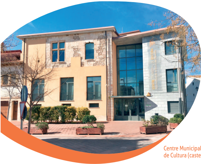
Centre Municipal de Cultura (castell)