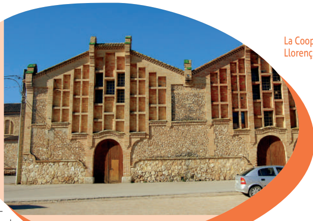
La Cooperativa de Llorenç del Penedès

Des d'aquí, caminarem direcció al Carrer del Sindicat per arribar a l'actual Cooperativa Agrícola de Llorenç del Penedès , anomenada popularment com el Sindicat Agrícola . Fou construït el 1920 i dissenyat per l'arquitecte català Cèsar Martinell, dissenyador d'altres cooperatives catalanes d'inicis del segle XX. La construcció d'aquest celler i molí