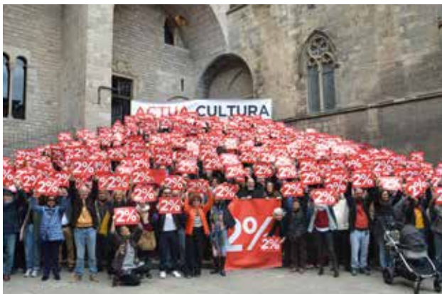
Concentració a la Plaça del Rei de Barcelona

Des de la FAC convidem a tots els ateneus federats i a totes les persones interessades en fer gran aquesta reivindicació a què donin el seu suport a la iniciativa Actua Cultura 2% a través d'un correu electrònic a l'adreça: actuacultura@gmail.com