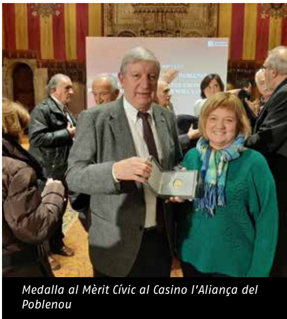
Medalla al Mèrit Cívic al Casino l'Aliança del Poblenou