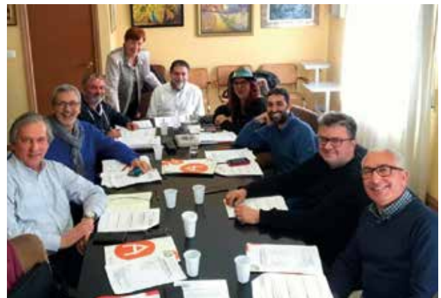
La Junta, al Casal l'Espluga de Francolí

La reunió va servir per posar fil a l'agulla al projecte de la FAC per als propers anys, i també per trobar-se, a la tarda, amb una part de la Delegació de les Comarques de Tarragona, per començar a preparar el que ha de ser la propera Trobada Nacional, el 2021.