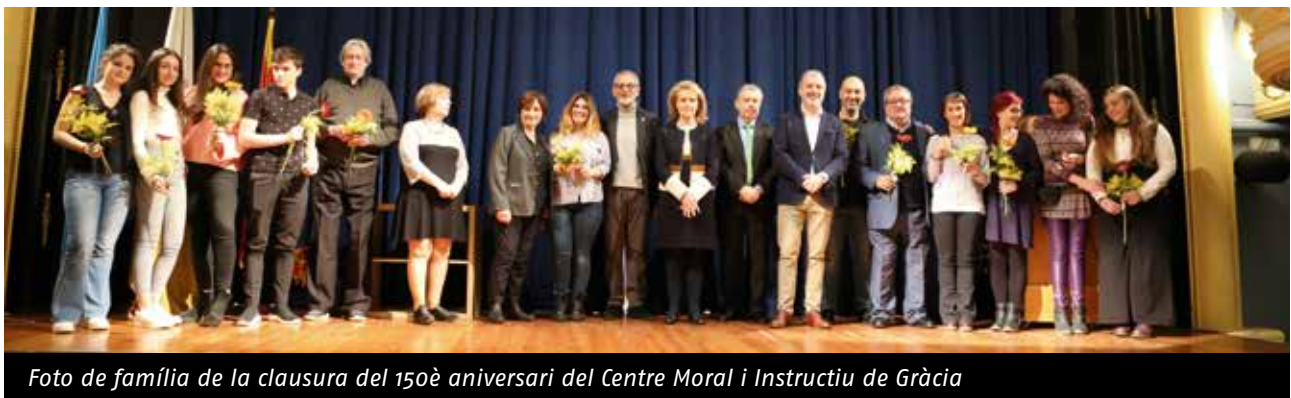
Foto de família de la clausura del 150è aniversari del Centre Moral i Instructiu de Gràcia

A la tarda es va fer a la sala d'actes l'espectacle «Una Altra Estrena» amb una gran afluència de públic, gaudint d'una magnífica representació de teatre musical.