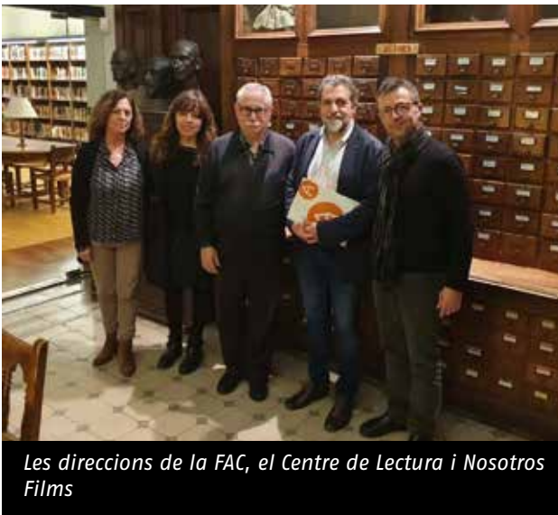
Les direccions de la FAC, el Centre de Lectura i Nosotros Films

El documental fa un recorregut per la història dels ateneus a través de cinc etapes ben marcades (l'inici, el creixement, la politització, la repressió i reorganització i la recuperació, la crisi i la reinvençió) i compta amb testimonis d'algunes persones importants del món ateneístic. A més, cal destacar que les instal·lacions del Centre de Lectura protagonitzen bona part del documental, ja que es tracta d'una de les entitats del món ateneístic més rellevants del territori català.