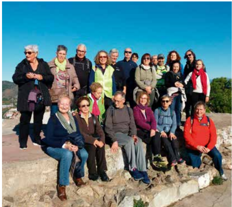
Foto de família als búnkers del Carmel, al Turó de la Rovira

La iniciativa va néixer l'any passat després d'una experiència molt reeixida de la Delegació de la Ciutat de Barcelona, que va decidir organitzar una caminada per diversos ateneus d'Horta i de Gràcia. La recaptació de les inscripcions va anar cap a fins solidaris. La DT de Barcelona ja ha repetit l'experiència, aquesta vegada pel districte de Sant Andreu, i això ha suscitat l'interès de molts ateneus del territori. Per organitzar una (o moltes!) edicions de Camins d'Ateneus, només cal que organitzis una sortida guiada amb aquests paràmetres i ens ho comuniquis a la FAC.