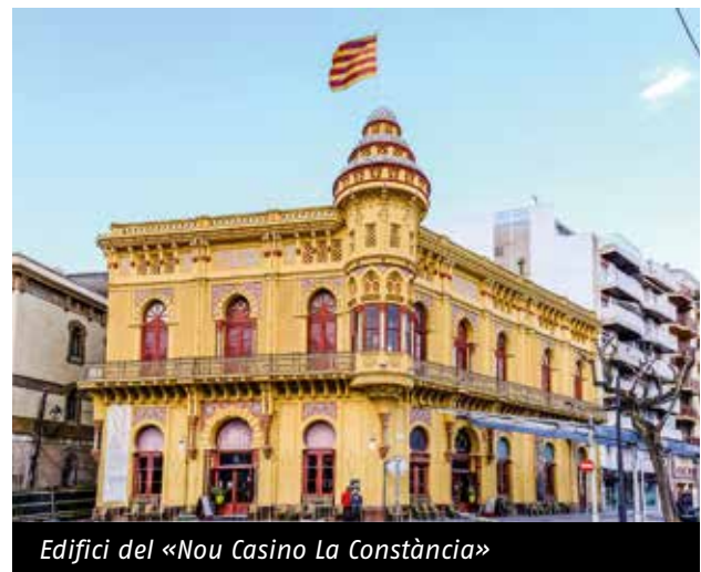
Edifici del «Nou Casino La Constància»