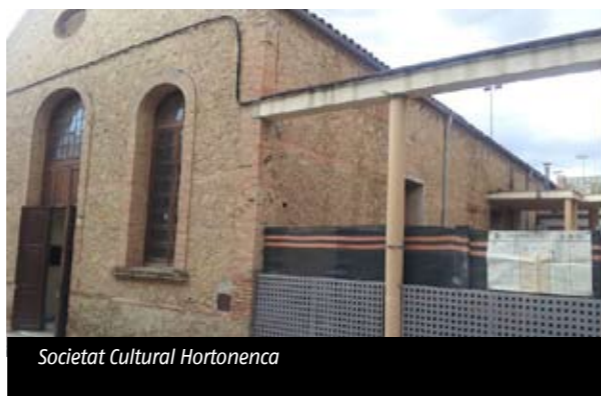
Societat Cultural Hortonenca