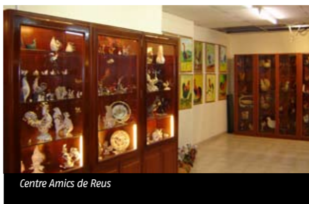
Centre Amics de Reus