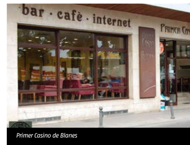
Primer Casino de Blanes