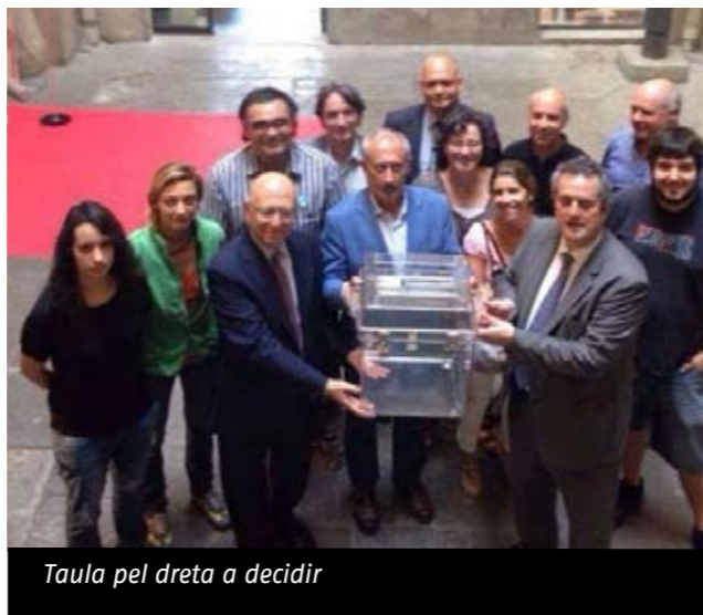
Taula pel dret a decidir

La FAC forma part de la recentment constituïda taula de Barcelona pel dret a decidir juntament amb el Consell d'Associacions de Barcelona, l'Ateneu Barcelonès, l'Ajuntament i altres entitats i col·lectius de la ciutat.