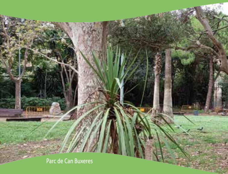
Parc de Can Buxeres

Aquest projecte el va començar la Delegació Territorial del Barcelonès, on es troben un gran nombre dels ateneus federats a la FAC i on es van realitzar rutes per barris com Gràcia, Horta i Sant Andreu. Gràcies a la bona rebuda d'aquestes rutes, actualment aquest projecte es duu a terme a tota Catalunya!