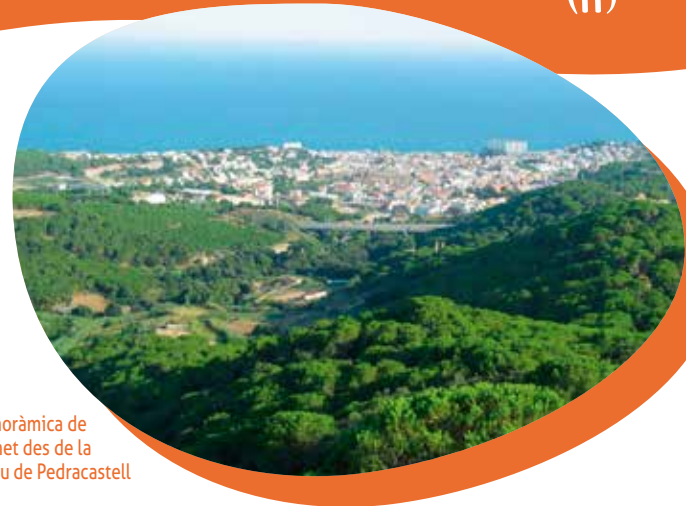
Panoràmica de Canet des de la Creu de Pedracastell

Seguirem cap el rial del Gel, observarem la mota dels rials, els canvis de nivell de la llera, les canyes, i l'alzinar. Ens fixarem en l'alog, d'aspecte hivernal, amb propietats antifrodisiaques; coneixerem el Projecte Alocs.