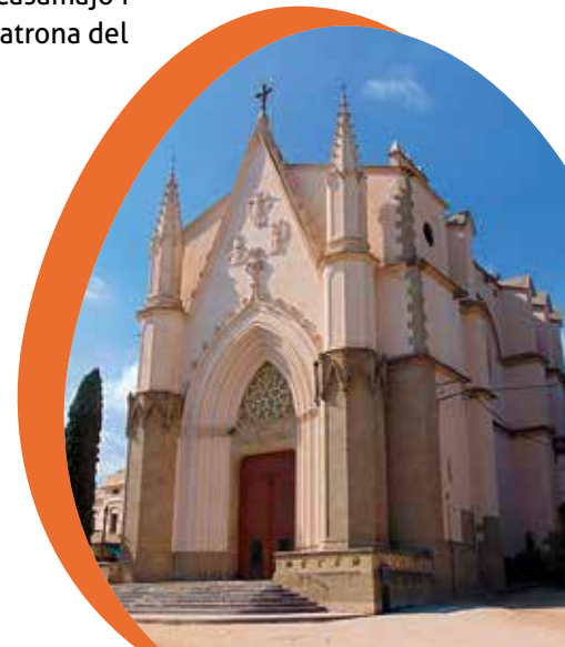
Santuari de la Mare de Déu de la Misericòrdia