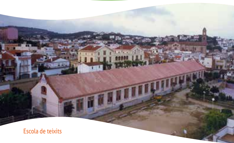
Escola de teixits

Riera Buscarons, 67 08360 Canet de Mar geaxxi@geaxxi.cat geaxxi.cat