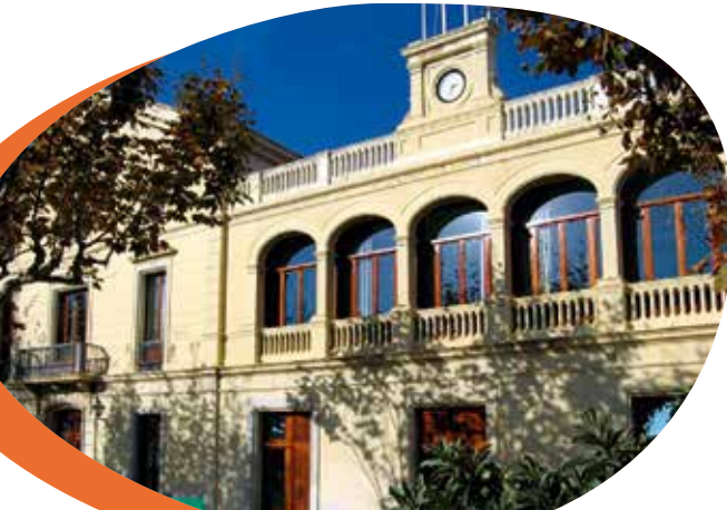
Escola de teixits

Continuant cap al polígon industrial, veurem la zona d'hortes, la planta de reciclatge de runes Casas i, en panoràmica, la Creu de Pedracastell . Tractarem la problemàtica del Maresme amb la pagesia.