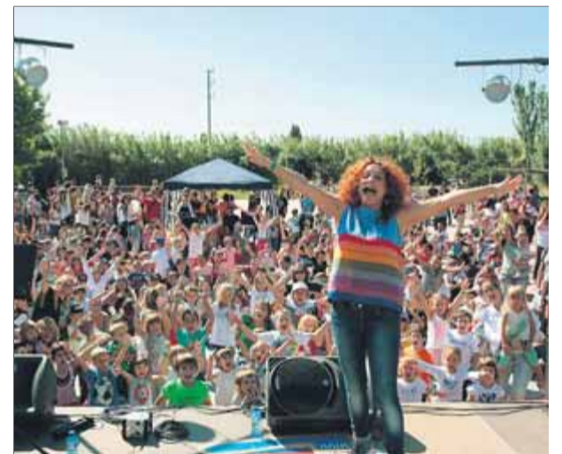
La primera edició d'El Clocamoll va ser un èxit ■ AGRAT

El festival, organitzat per l'entitat targarina Agrat amb el suport de l'Ajuntament, va ser una iniciativa d'un grup de sòcies d'Agrat. L'esperit és gaudir d'un dia de concerts i tallers que agradin tant als menuts com als seus pares. Si en la primera edició, duta a terme al setembre, les 800 entrades es van esgotar ràpidament, enguany sembla que es repetirà l'èxit. I això que l'organització ha doblat l'espai d'activitats, que es traslladen a l'escola Maria Mercè Marçal. L'aforament és de 1.450 persones i, ara mateix, encara queden uns 500 ti-