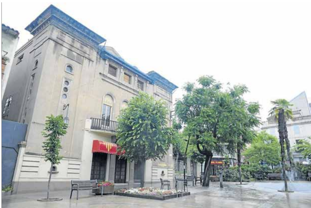
L'Ajuntament s'ha quedat l'històric edifici del Casino pagant mig milió i s'obrirà un procés participatiu per definir-ne l'ús