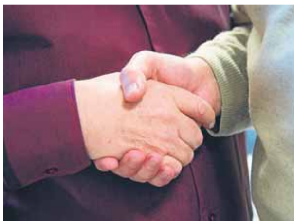
La cooperativa pot ser l'eix d'una nova economia social ■

Amb un pressupost de 3.300.000 euros, la iniciativa del departament consisteix en la creació de quinze ateneus cooperatius, distribuïts per diverses demarcacions.