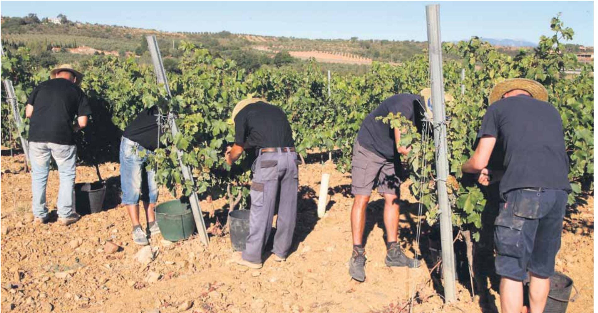
Els socis o integrants de l'entitat cooperativa són el centre d'un projecte arrelat al territori que té la cooperació com a base del seu funcionament ■ JOAN SABATER